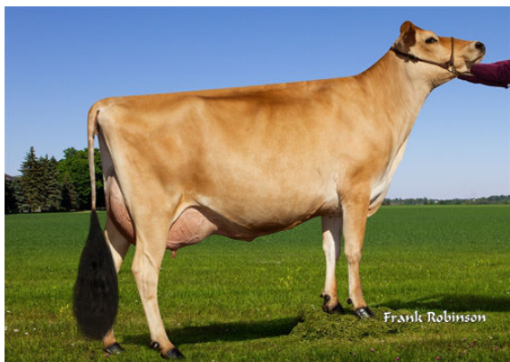
PROGENESIS MADISON- DAM

RIVER VALLEY HERITAGE PROGENESIS MADISON EX-90%-3YR-USA JX RIVER VALLEY CHIEF {6} RACHELLES VICEROY LOUISE VG-88%-6YR-USA CDF VICEROY RACHELLES GENOMINATOR 7857